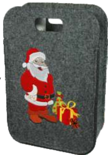
TORBA NA UPOMINKI