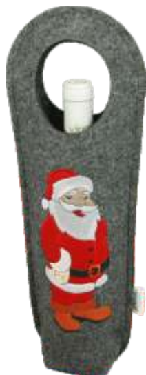
TORBA NA WINO