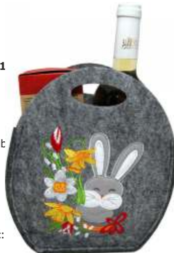
TORBA NA UPOMINKI