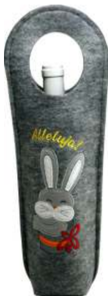
TORBA NA WINO